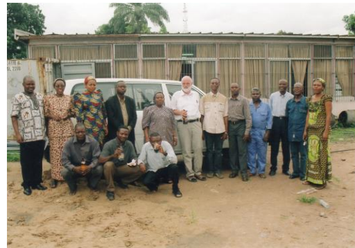
11/2014: Die CENCO in Kinshasa/ mein Team