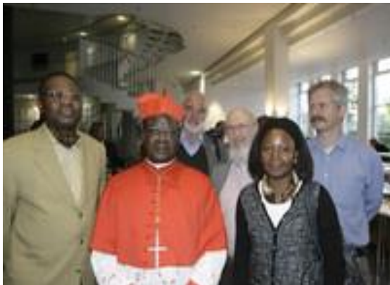
4/2012: Msgr. Monsengwo empfängt den ökumenischen Friedenspreis in Berlin