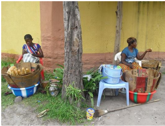
1/2014: Brotfrauen am Strassenrand (Gombe)