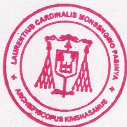
+ L. Cardinal MONSENGWO PASINYA Archevêque de Kinshasa

Archevêché de Kinshasa, le 20 janvier 2015.